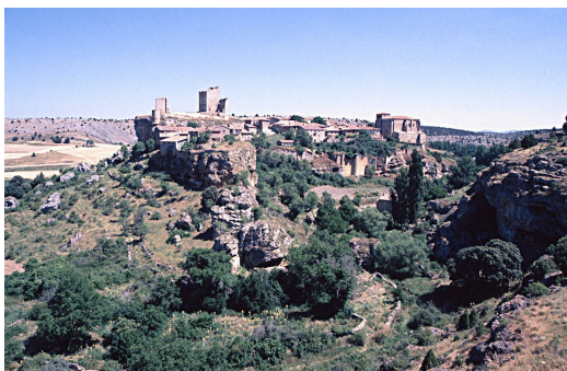
Calatañazor desde el Sureste