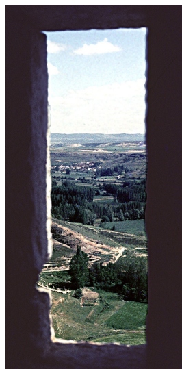
El valle del Riaza desde la torre de la iglesia de Haza